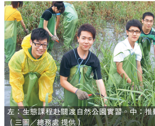
左：生態課程赴滬渡自然公園實習。中：推動二手教科書流通平台。右：將宿舍汰換的床板變身海報櫃。

智慧財產權 Q and A 1. ( ) 著作財產權的存續期間是著作人的生存期間，加上其死亡後幾年？(1) 10年 (2) 30年 (3) 50年。 2. ( ) 下列敘述何者不正確？(1) 規定不能盜拷電腦軟體，是因為要尊重他人智慧結晶。(2) 在網路上看到好看的文章、好聽的歌曲，將它貼在自己的網站上供網友閱覽。(3) 如果只是單純上網瀏覽影片、圖片、文字或聽音樂，並不會違反著作權法。 3. ( ) 法律保障創作和發明，下列那一種行為違反著作權法？(1) 偷看別人的書信。(2) 模仿人家的簽名。(3) 拷貝電腦遊戲程式送給同學。 答案 1. (3) 2. (2) 3. (3)