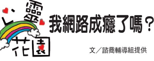
文/諮商輔導組提供

注重生命教育 建立「留狗」檔案，並設置小狗立牌來勸導勿餵食流浪狗，減少滯留所造成的環境髒亂。 確實校園安全 人車道以不同顏色作區別以增加辨識度，校內建置2條安全路線及改善照明，設有9座緊急求救裝置、校園勤務中心全天候保持連線暢通。