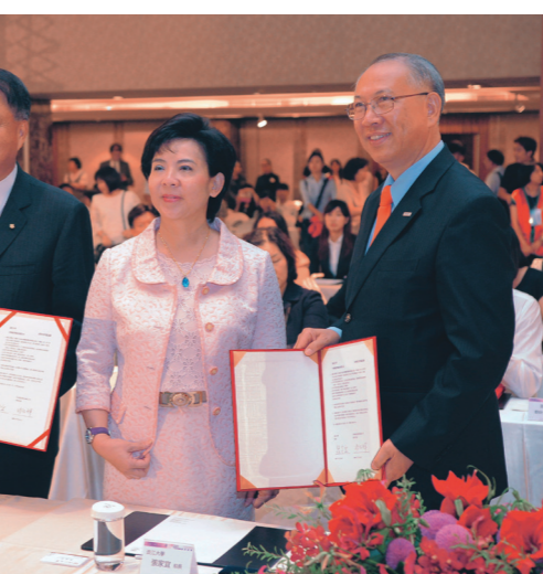
上月21日，本校邀請上銀科技、華航、富邦人壽等近200家企業攜手簽訂產學聯盟協議，提供近千名實習名額，為淡江學生開創就業之門。圖為校長張家宜(中)與上銀科技董事長卓永財(右)、華航董事長孫洪祥(左)簽訂產學合作協議。