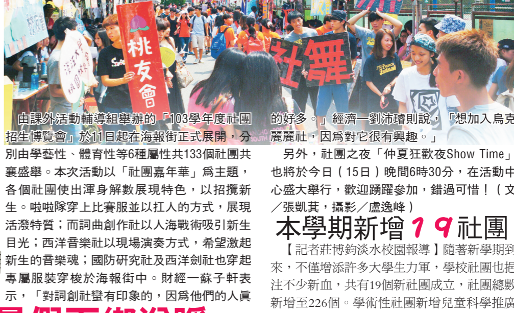
由課外活動輔導組舉辦的「103 學年度社團招生博覽會」於 11 日起在海報街正式展開，分別由學藝性、體育性等 6 種屬性共 133 個社團共襄盛舉。本次活動以「社團嘉年華」為主題，各個社團使出渾身解數展現特色，以招攬新生。啦啦隊穿上比賽服並以扛人的方式，展現活潑特質；而詞曲創作社以海戰術吸引新生目光；西洋音樂社以現場演奏方式，希望激起新生的音樂魂；國防研究社及西洋劍社也穿上專屬服裝穿梭於海報街中。財經一蘇子軒表示，「對詞曲社有印象的，因為他們的人真