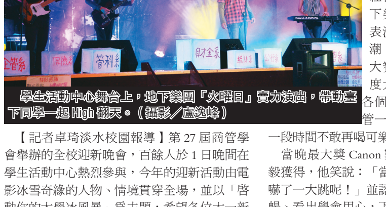
學生活動中心舞臺上，地下樂團「火曜日」實力演出，帶動臺下同學一起High翻天。

商管學會全校迎新 High 翻天 【記者卓琦淡江校區報導】第27屆商管學會舉辦的全校迎新晚會，百餘人於1日晚間在學生活動中心熱烈參與，今年的迎新活動由電影冰雪奇緣的人物、情境貫穿全場，並以「啟動你的大學冰風暴」為主題，希望各位大一新生能夠拋開過去的高中生活，「Let It Go」，勇敢地向大學新生活啟程！