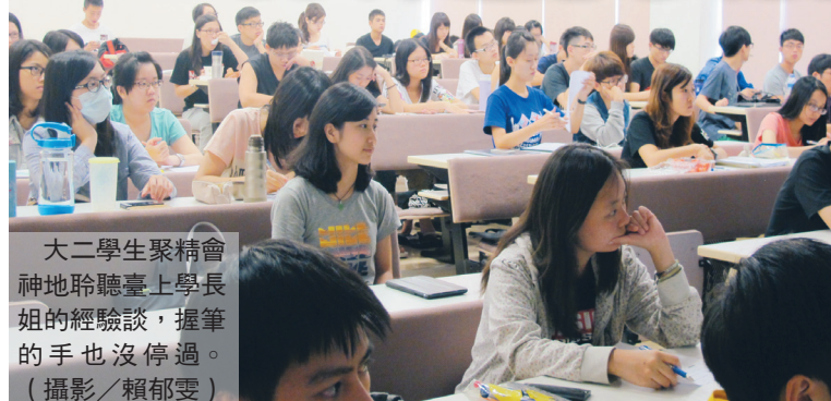
大二學生聚精會神地聆聽臺上學長姐的經驗談，揮筆的手也沒停過。

朱天文 獲美國紐曼華語文學獎 【記者陳昇暉淡江校區報導】美國《紐曼華語文學獎》於上月19日公布2015年得獎名單，英文系系友朱天文從5位入圍者中脫穎而出，獲此殊榮。她不僅是紐曼華語文學獎第1名女性作家，也是繼楊牧之後，第2位獲獎的臺灣作家。將可獲得美金1萬元的獎金，並將受邀前往奧克拉荷馬大學進行一系列學術活動，頒獎典禮將在明年3月6日舉行。