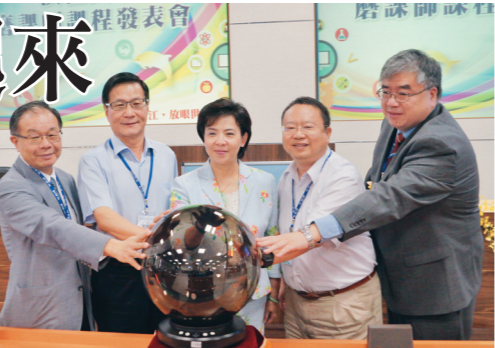
3 門磨課師課程各具特色，於 27 日起正式開課，歡迎同學多加利用。(文/李昱萱、攝影/盧逸峰)

張校長致詞表示：「教育部近年極力推行磨課師課程，本校非常榮幸有 3 堂課獲選，分別是 e 筆書法、物聯網概論、會計學。磨課師是淡江網路校園很重要的新起點，推行磨課師除了專業與技術外，教師的熱情也十分重要，希望未來有興趣的教師同仁們可以參與磨課師課程。」