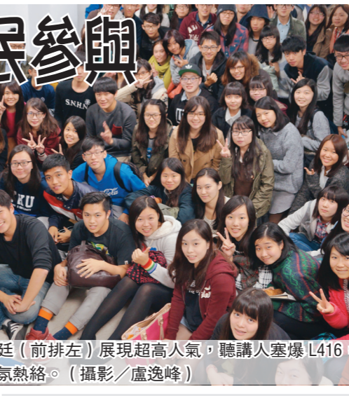
陳為廷(前排左)展現超高人氣，聽講人塞爆 L416，現場氣氛熱烈。

【記者卓琦淡水校園報導】「上週末有回家投票嗎？」這是太陽花學運領袖、公民團體島國前進發起人陳為廷，於 2 日在 L416 開淡江學生的第一場問題。他以「從校園民主看公民參與」為題進行演講，讓 70 人教室湧入逾 150 人，許多學生席地而坐聽講。