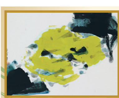
藝輝守謙系列作品