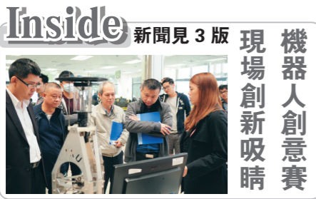
機器人創意賽 現場創新吸晴

984期 中華民國104年 11月30日 星期一 發行所/淡江大學 創辦人/張建邦 發行人/張家宜 社長/馬雨沛 社址/新北市淡水區英專路151號