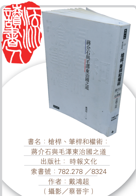
書名：槍桿、筆桿和權術：蔣介石與毛澤東治國之道 出版社：時報文化 索書號：782.278 / 8324 作者：戴鴻超