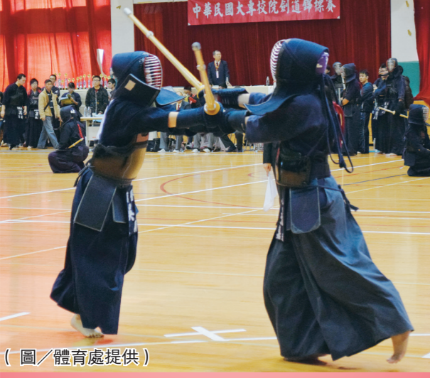
淡江劍道隊在錦標賽中獲獎。