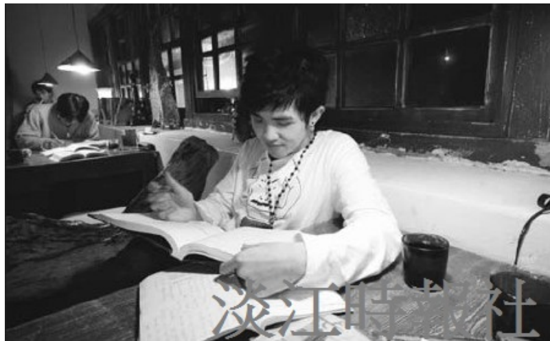
水源街的簡餐店「藍石頭」是許多研究生進行小組討論的去處。