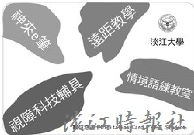
淡江數位學習示意圖