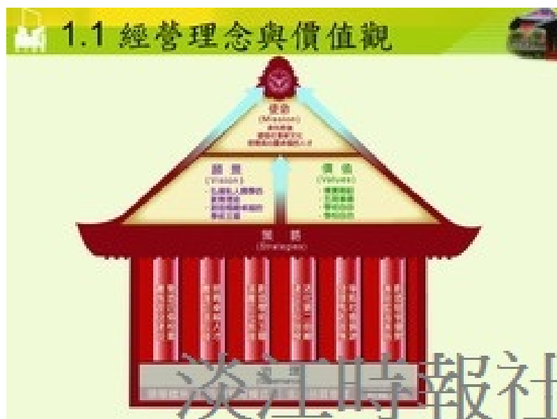
經營理念與價值觀