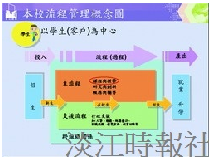
本校流程管理概念圖