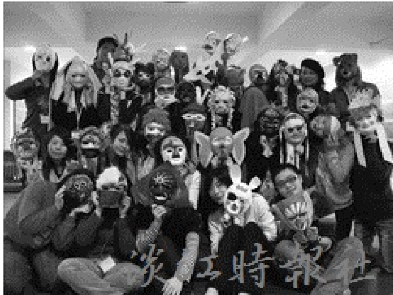
97年3月23日教心所學生參加表達性藝術治療國際研討會會後工作坊，利用自己製作面具的過程中學習心理療法。