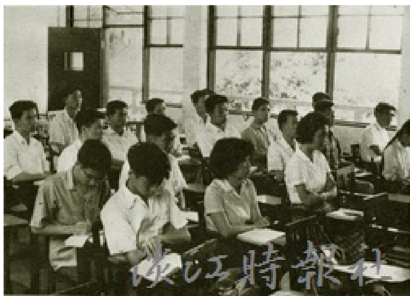
民國52年，學生穿著制服在宮燈教室上課，和現今同學上課的情景大不同。