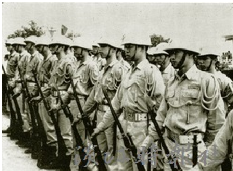
民國50年代軍訓課全副武裝、實地演練。