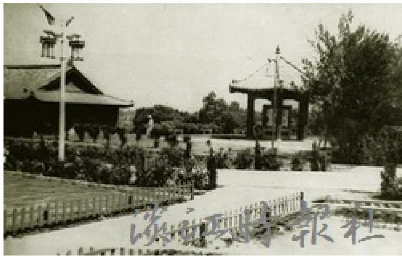
民國40年代，花木初植，覺軒花園附近的宮燈教室尚未建起，圖為自覺軒花園照過去的景色。