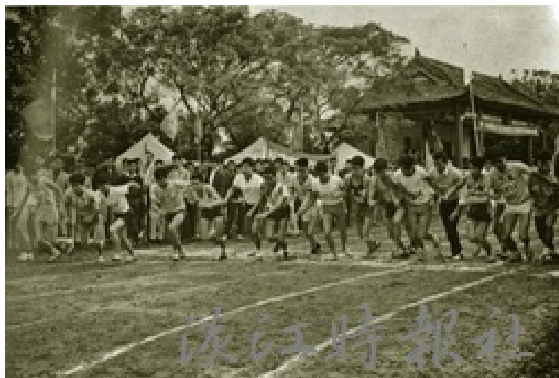
二十週年淡江文理學院院慶舉辦萬米賽跑，當時的操場和現在的情景差異很大。