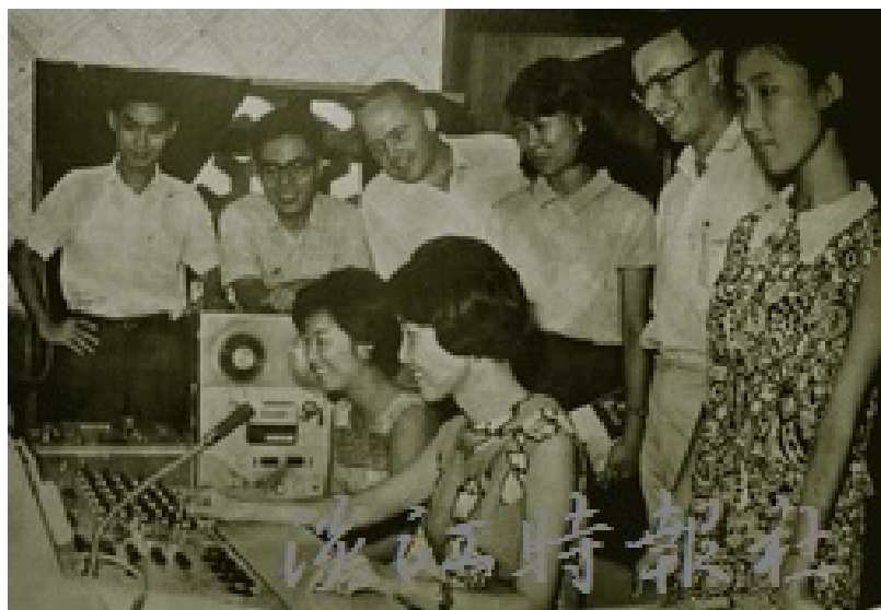
民國56年「英語講習班」使用語言教室的情景，顯見本校的設備在當時已十分先進。