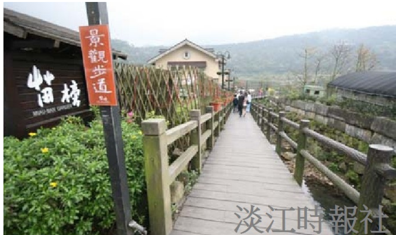
竹子湖海芋季，許多農園皆有開放採海芋，苗榜海芋園是網路上頗獲好評的商家之一。