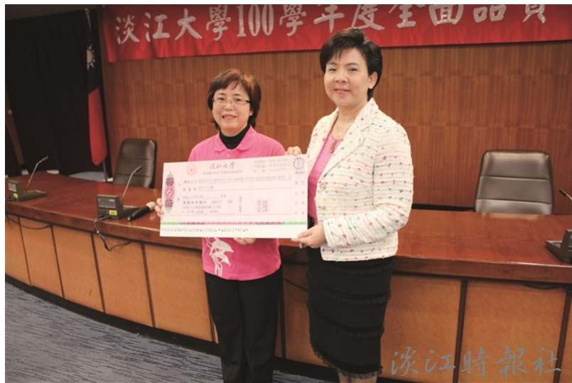
本年度品管圈冠軍圈ECO招才圈，由招生組與專案發展組共同組成。校長張家宜（右一）頒贈獎金及獎狀以資鼓勵。