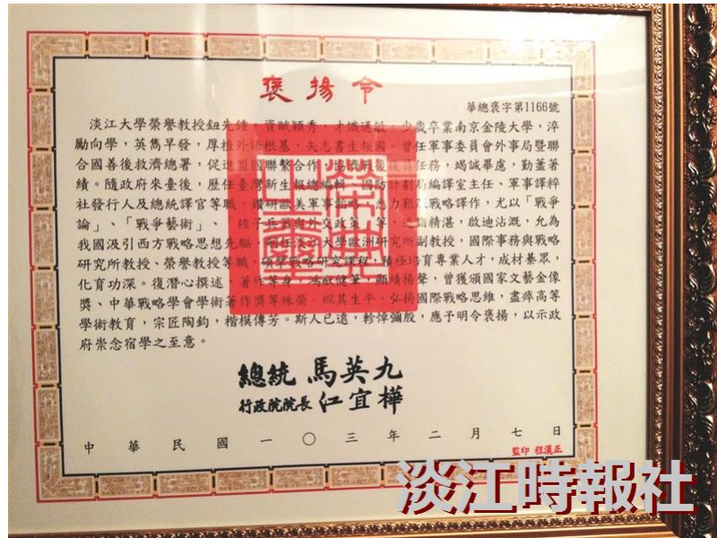
今年2月總統馬英九頒贈褒揚令。