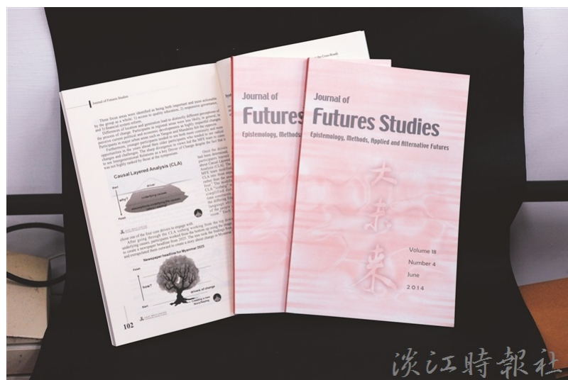
未來學所出版英文未來學國際學術期刊《Journal of Futures Studies》季刊。