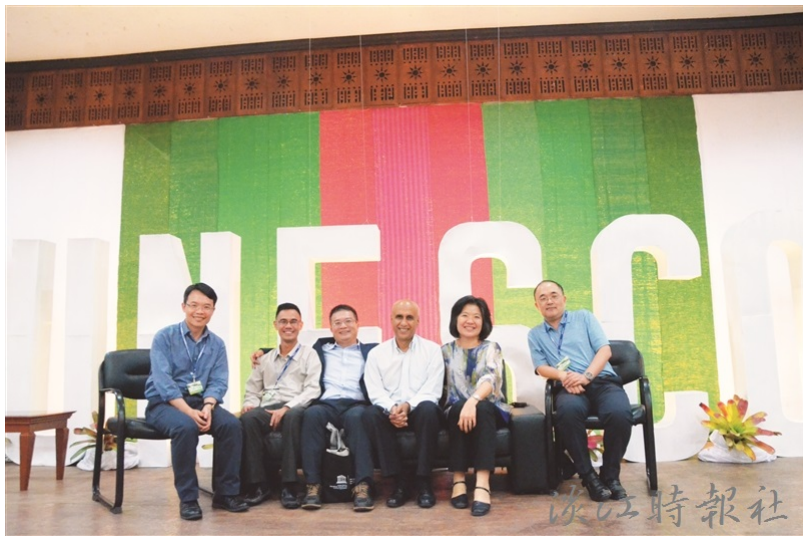
未來學所5位教師再度與UNESCO合作，在菲律賓擔任工作坊引導員，並與國際學者合影。