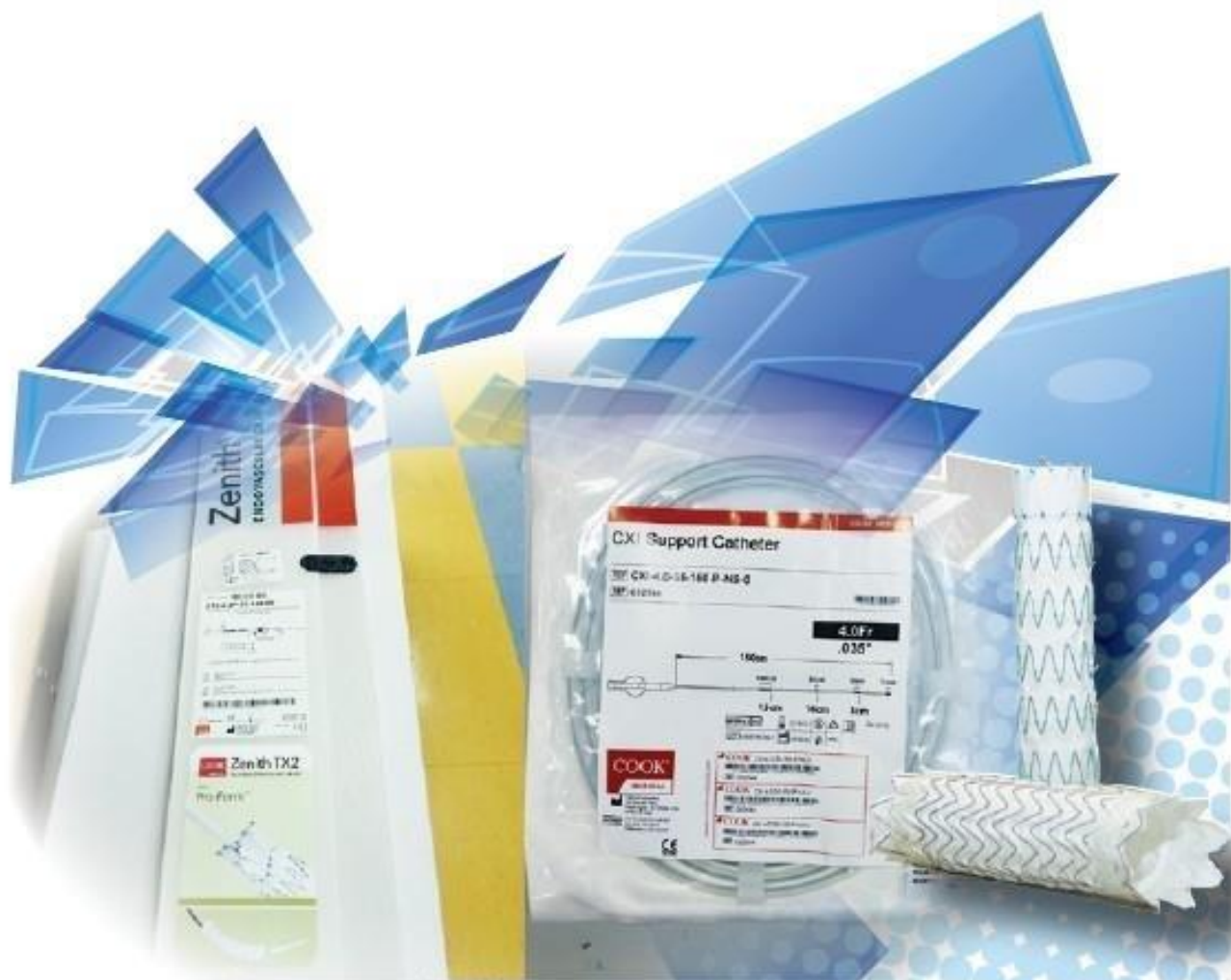
醫療器材合成圖。(攝影／盧逸峰、圖／醫資中心提供) 淡江時報社