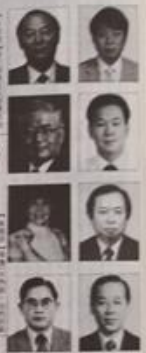
貴賓賓禮三畫 城田者朝視視