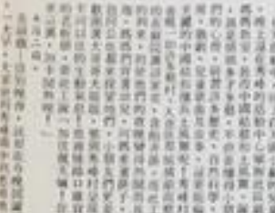
作工社研兒小國時青對民鄉公鹿

「秀峰中心」是鹿谷鄉唯一的福利中心，也是鹿谷鄉唯一的福利中心。秀峰中心是由「慈幼社」主辦的。秀峰中心的工作，是為鹿谷鄉的福利工作，提供一個良好的環境，讓福利工作能順利進行。秀峰中心的工作，是為鹿谷鄉的福利工作，提供一個良好的環境，讓福利工作能順利進行。