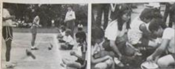
二地土拜一賽球味趣會幼幼幼幼

我們是在三月一號(週一)晨八點多由台北出發，五個大人和十個小孩，坐著火車到鹿谷。在鹿谷，我們住在「鹿谷鄉秀峰中心」(秀峰中心)。「秀峰中心」是鹿谷鄉唯一的福利中心，也是鹿谷鄉唯一的福利中心。秀峰中心是由「慈幼社」主辦的。秀峰中心的工作，是為鹿谷鄉的福利工作，提供一個良好的環境，讓福利工作能順利進行。秀峰中心的工作，是為鹿谷鄉的福利工作，提供一個良好的環境，讓福利工作能順利進行。