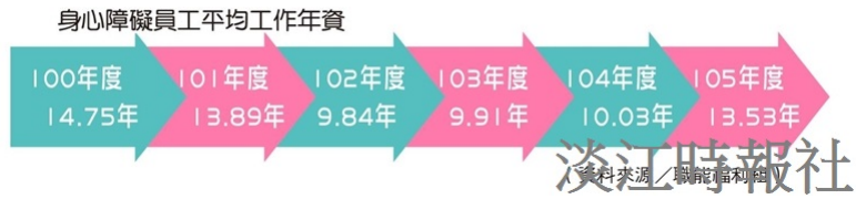
身心障礙員工平均工作年資。(資料來源／職能福利組)