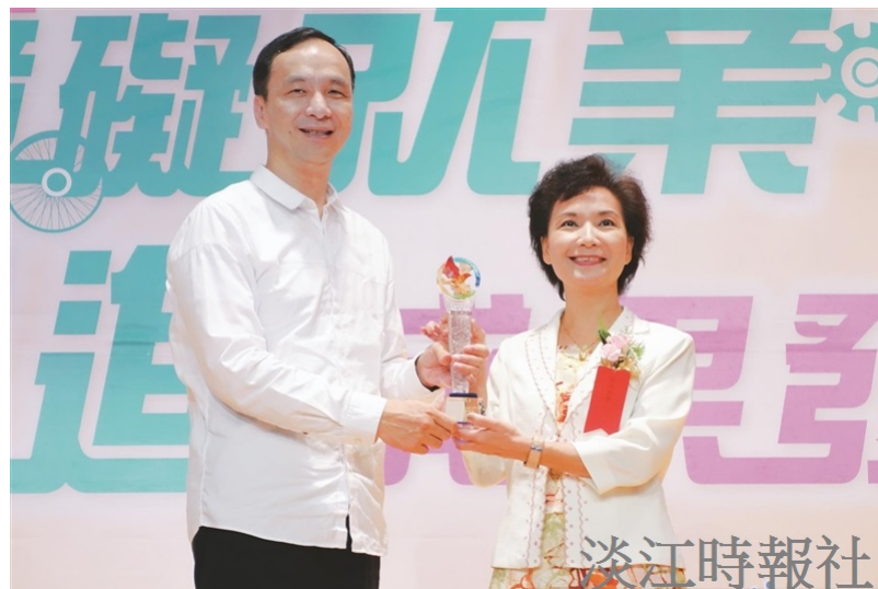
人資長莊希豐（右）代表本校接受新北市市長朱立倫頒獎表揚。