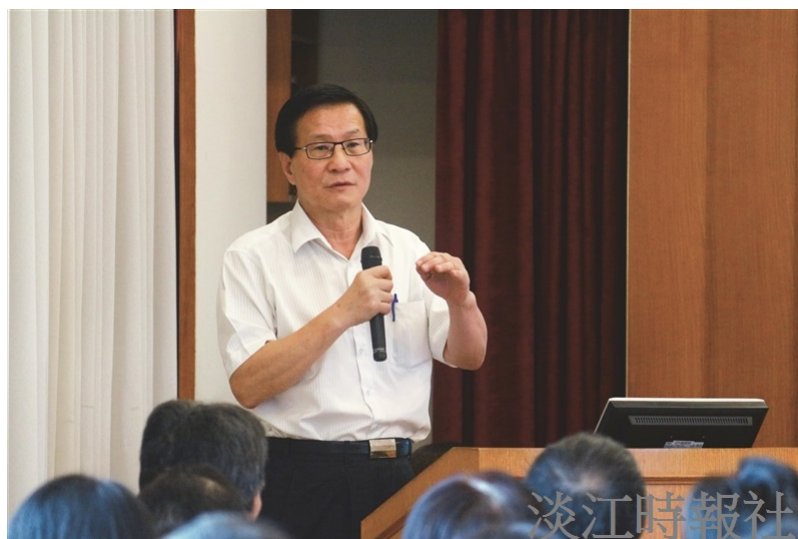
分組報告：第一組結論報告