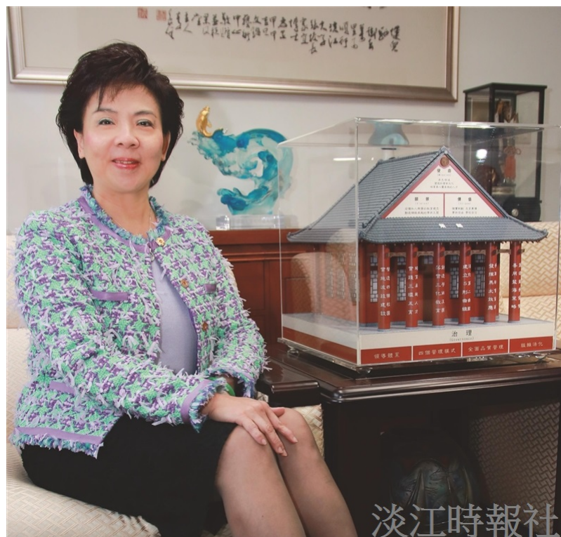
校長 張家宜博士：「培養終身學習，充分體現淡江DNA」

淡江大學於2017WRWU 世界大學網路排名一、全球第 394 名、亞洲第 39 名、全國第 6 名