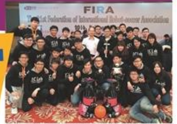
▲本校機器人研究團隊於去年應邀赴北京參加「第21屆2016 FIRA世界盃機器人足球賽」，贏得4金1銀3銅佳績。