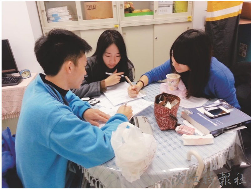
學習與教育中心學生學習發展組協助學習成效不佳同學進行課業輔導，提升學習成效。