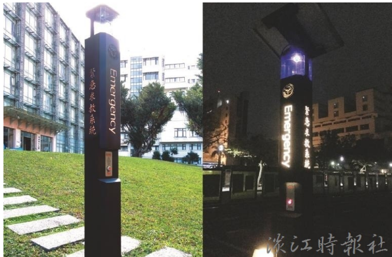
校園內設置之「緊急求救系統」

為協助住校同學夜間平安回到宿舍，學校規劃兩條安全道路，並在途中設置11個「緊急求救系統」，若遇緊急或突發狀況時能即時回報。