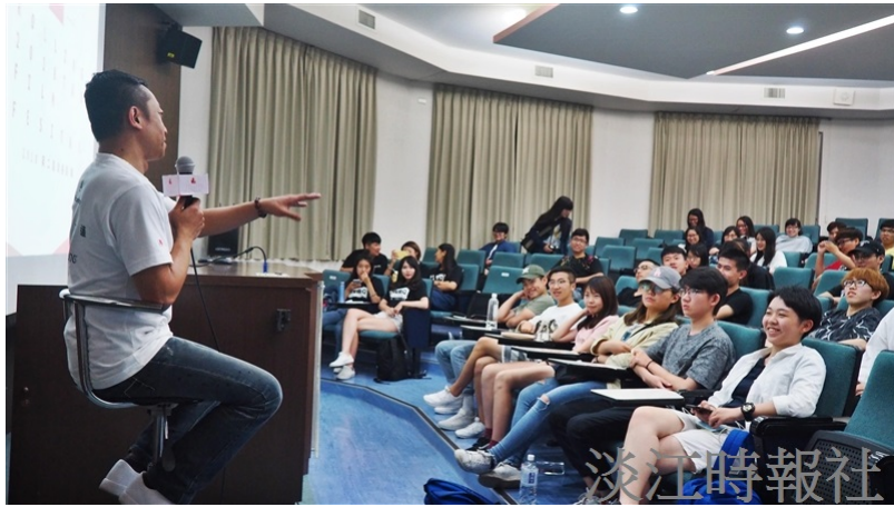
淡捲影展邀楊雅喆揭幕