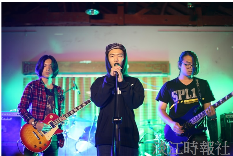
音樂文化社「搖滾吧飛Rock' n buffet」