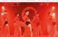
▲舞蹈社於 8 月 18 日晚在體育館第一樓社團廣場舉辦迎新活動...