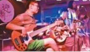
▲由曲創作社於 8 月 17 日在體育館舉辦迎新音樂會...