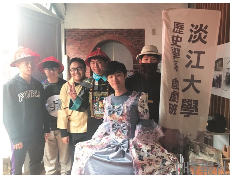
本校歷史系學生配合教育部USR與高教深耕計畫演出清法戰爭。