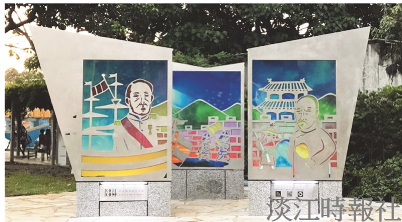
「清法戰役·滬尾時空再繪」裝置藝術以滬尾戰役為主軸，再現古戰場情境。