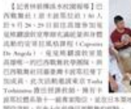
▲巴西戰舞社南下體驗 Angola。

【記者林祥波淡江校區報導】巴西戰舞社（Brazilians）於 9 月 28、29 日前往高雄參加由淡江大學主辦的「2019 年全國學生巴西戰舞社交流活動」。圖為活動現場。