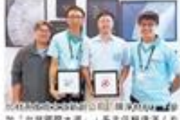
化材校友企業獲U-start競賽冠軍。