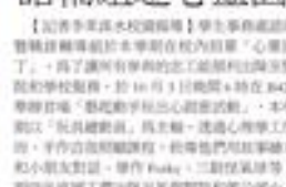
▲諮輔組邀心靈園丁藝起動手玩創意。

【記者李俊傑淡江校區報導】學生會諮輔組於 9 月 27 日邀請心靈園丁，為學生提供心靈輔導。圖為活動現場。