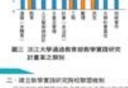
圖三 淡江大學通過教育教學實踐研究計畫案之類別