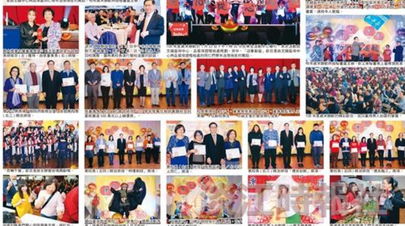
109年度歲末聯歡於1月22日下午3時30分在學生活動中心舉行，此次活動由文藝中心、品保保健部共同主辦，活動中，「送春聯歡」節目是由文藝中心與品保保健部共同主辦的同仁們帶來精彩絕倫的舞蹈。圖為歲末聯歡活動精彩瞬間。

【淡江時報訊】109年度歲末聯歡於1月22日在學生活動中心舉行，活動由文藝中心、品保保健部共同主辦，校長黃國發、董事會黃國發、副校長林文龍、4位副校長、二級主管、所有教職同仁及退休人員踴躍參與，當晚由董事會及副校長頒發「107年度專任教師學術研究計畫經費500萬元以上績優獎」，對傑出貢獻者頒發「107年度專任教師學術研究計畫經費500萬元以上績優獎」。