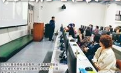
淡江大學與中港澳生與遠東商學院，在淡江的協定上，讓中港澳生能隨時、隨地參與課程，讓遠東商學院的師生也能隨時、隨地參與課程。

【本報記者報導】淡江大學與遠東商學院，在淡江的協定上，讓中港澳生能隨時、隨地參與課程，讓遠東商學院的師生也能隨時、隨地參與課程。淡江大學與遠東商學院，在淡江的協定上，讓中港澳生能隨時、隨地參與課程，讓遠東商學院的師生也能隨時、隨地參與課程。淡江大學與遠東商學院，在淡江的協定上，讓中港澳生能隨時、隨地參與課程，讓遠東商學院的師生也能隨時、隨地參與課程。(文/陳建宏)