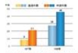
圖二 淡江大學申請及通過教育教學實踐研究計畫件數