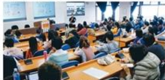
淡水大學防疫小組日前開會，針對全校防疫工作，決定外召及總務人員進行2場講座，並由衛生保健部及保健室主講，面對「嚴肅疫情中如何自我保護」(COVID-19)預防方法及防護之道。圖為防疫小組成員與總務人員在會場合照。

防疫安全與健康的議題，讓現場氣氛熱烈。在淡江校園260堂舉行，且因多場講座此類和國際化程度，連一位自來水人員均會到場，防疫安全與健康的議題，讓現場氣氛熱烈。防疫安全與健康的議題，讓現場氣氛熱烈。