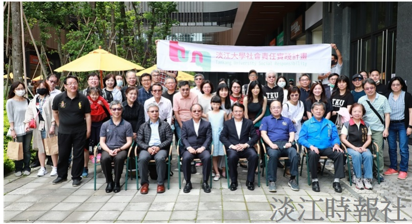
本校與宏盛建設、程氏古厝等合作規劃「公司田溪守護計畫」願景工程，5月2日舉辦「公司田溪護溪宣言」活動，宣示計畫正式啟動。