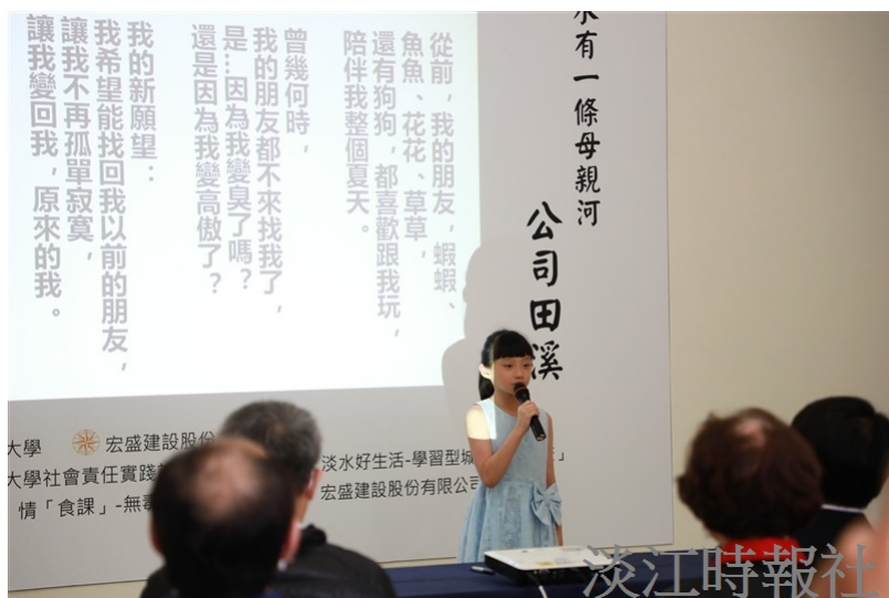
神秘嘉賓「小溪」以公司田溪之名許下願望，希望能回復到原本清澈的樣貌，找回原來的魚蝦花草等好朋友，不再孤單。