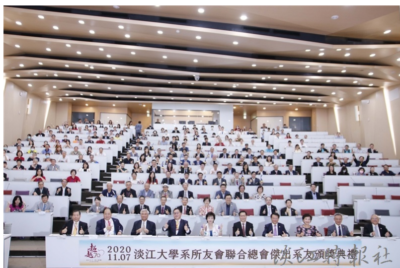
所友會聯合總會於11月7日在守謙國際會議中心有蓮廳舉辦「傑出系友頒獎典禮」，校友高朋滿座。