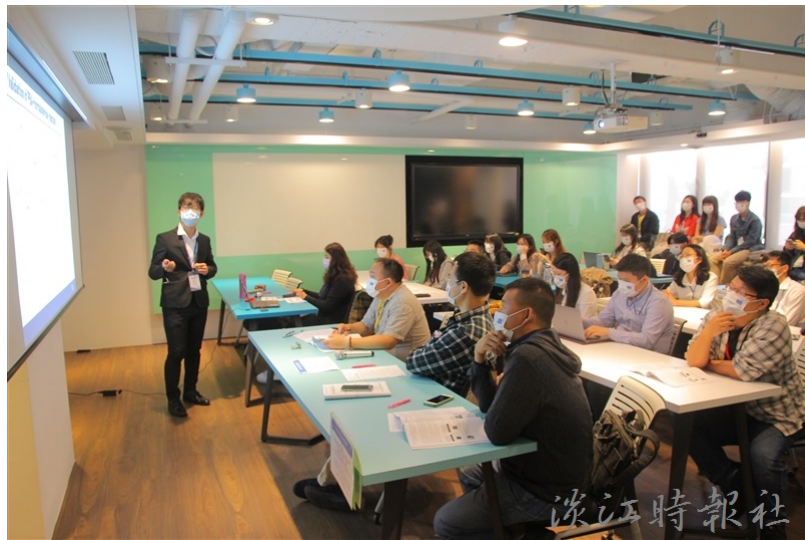
化學系論壇吸引全臺各大學百位同學參加口頭發表論文或壁報發表，彼此交流。