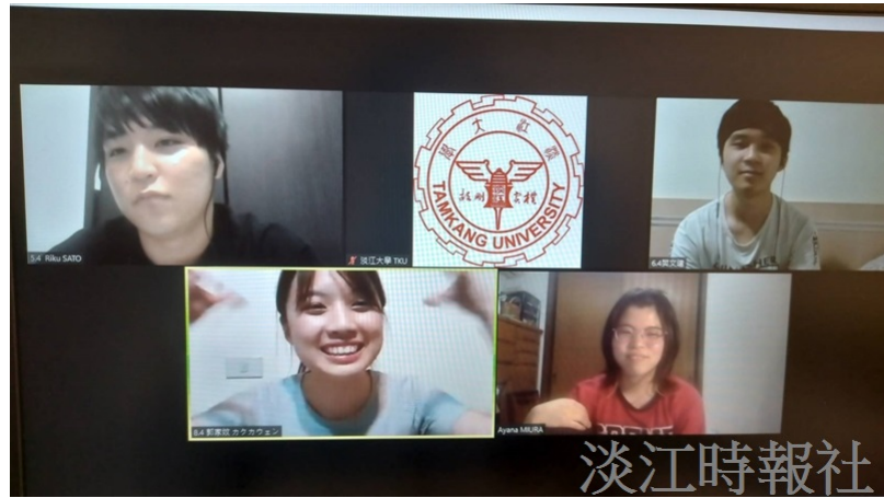
雙方學生開心進行小組交流。