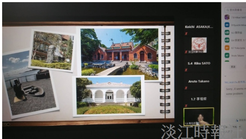
本校學生向對方學生介紹淡水觀光景點。