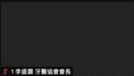
1 李燕燕 牙醫協會會長