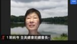
1 鄧麗芳 全美總會前總會長