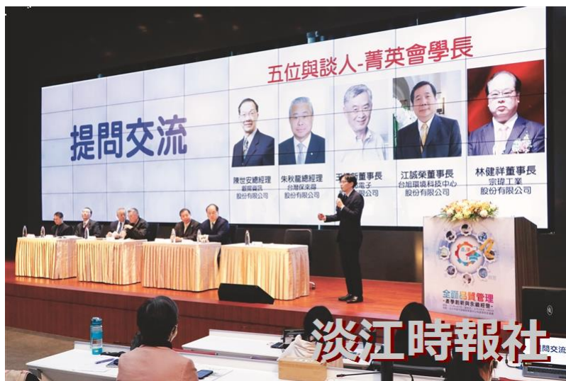
110學年度TQM研習會中，菁英會之5家校友企業分享自身企業推動永續發展的經驗，並進行意見交流。