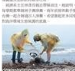
▲淡江大學經濟系師生於9月24日前往洲子灣淨灘。