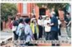
▲淡江大學前古蹟教堂走讀速寫活動，探索北臺灣百年歷史。