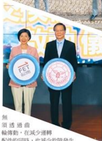
文／陳映樺 朱映嫻 吳沂誼