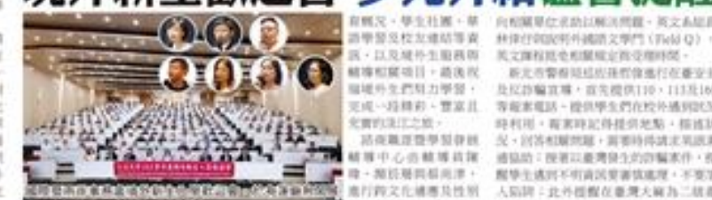
淡江大學舉行新生歡迎會，多位校務處長與新生見面。

【淡江專訊】淡江大學將於9月11日(週六)上午10時在淡江大學體育館舉行「克難坡」新生入學體驗活動。校長林宜男率領新生加入淡江大學，從第一課開始就與淡江學子共同學習、共同成長。校長林宜男表示，新生入學體驗活動，是新生入學的第一課，也是新生入學的第一課。