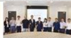
淡江大學校長林宜男(左二)率領多位校務人員，於9月10日帶領新生入學體驗第一課。

【淡江訊】淡江大學校長林宜男日前在淡江大學與越南太原大學校長陳文雄簽署合作備忘錄，兩校將以「AI+SDGs」為核心理念，共同推動數位教育與永續發展。林校長表示，此次合作是兩校長期以來友好關係的進一步發展，也是兩校在國際化與數位教育領域的重要合作。此次簽署的備忘錄，旨在加強兩校在數位教育、永續發展、國際交流等方面的合作。林校長表示，淡江大學將致力於推動數位教育與永續發展的結合，為全球社會培養更多具備數位素養與永續意識的人才。此次合作將有助於兩校在國際化與數位教育領域的深入交流與合作，共同推動全球教育事業的發展。