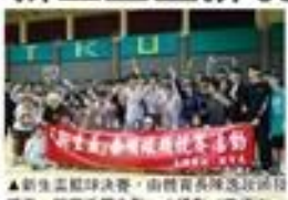
▲新生盃籃球決賽，由體育系隊隊隊隊隊隊隊。

【本報訊】新生盃籃球排球網球賽果出爐。各項比賽競爭激烈，展現了新生們的體育精神。