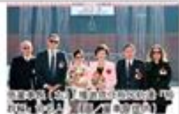
裕民航空貨運輪命名典禮，張董事長獲邀為裕民航空貨運輪命名。