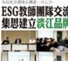
ESG教師團隊交流，集思建立淡江品牌。