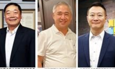
淡江菁英金鷹獎頒獎典禮嘉賓合影