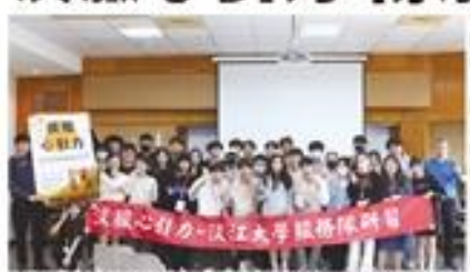
▲淡服心引力12月8日至10日舉辦「淡服心引力—服務學習研習營」，大家開心合影。

【記者林若水報導】淡服心引力服務學習研習營，於12月8日至10日在淡江大學信誼紀念廳舉行，吸引了來自淡江大學各系所、院系的師生參加。研習營由淡服心引力服務學習中心主辦，旨在推廣服務學習理念，提升學生的社會責任感與實踐能力。