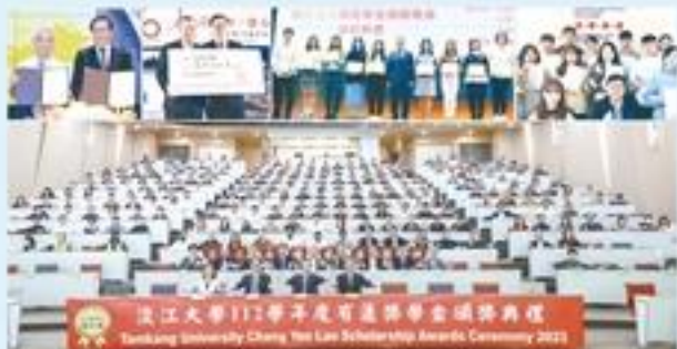
本校設置「樸實剛毅獎助學金」，對應就學4個階段提供各類獎助學金，讓學生可以無後顧之憂的安心就學。

【僑務局淡江校園報導】為獎勵學生認真學習，協助不同學業成就及經濟不利者順利就讀並完成高等教育，本校特別設置「樸實剛毅獎助學金」，每年總額超過新臺幣2億元，提供逾200種獎助學金，讓學生可以無後顧之憂、安心就學。在三項五育課程的當下，朝心靈卓越目標邁進。