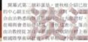
2024 年第 13 屆村上春樹國際研討會。