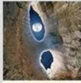
WHAT WORKS: Case Studies in the Practice of Foresight