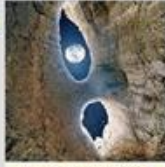
WHAT WORKS: Case Studies in the Practice of Foresight