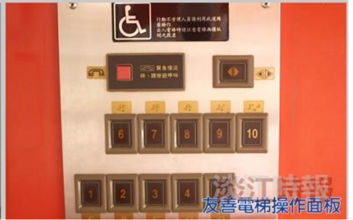
友善電梯操作面板