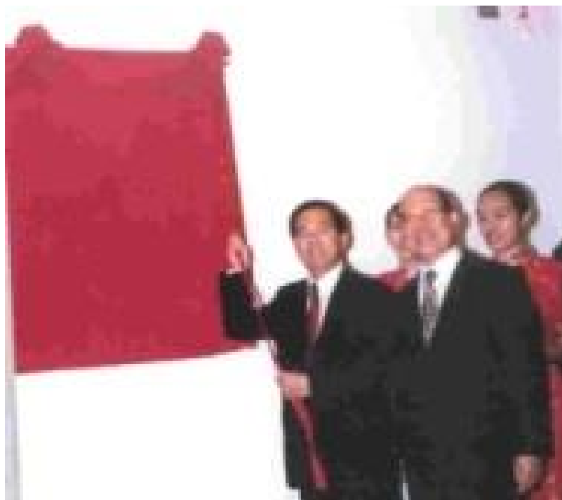
陳總統親自為所頒「育才弘藝」匾額揭幕。（記者張佳萱攝）